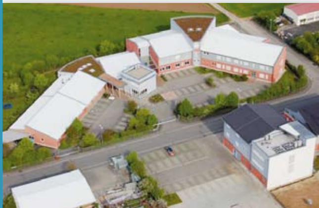
Firmensitz der FIS, Grafenrheinfeld

Am 03.06.2008 hat die FIS die Firma SST „Software Solutions Team Sp. z o. o.“ mit Sitz in Gliwice (Gleiwitz), Oberschlesien/Polen übernommen. FIS hat damit eine Tochter für die Region Polen – Ungarn – Tschechien – Slowakei. Die Firma beschäftigt hoch qualifizierte Mitarbeiter (Informatiker/Ingenieure) und ist tätig auf den Gebieten SAP, Java und .NET.