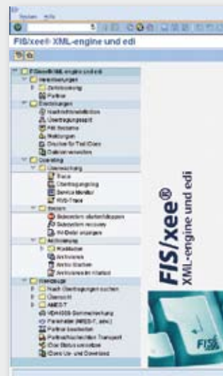
FIS/xee® – Menü